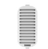
空気取入口フィルタ