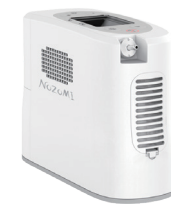
バッテリー付き本体